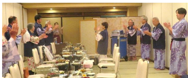
翌日の地区大会へつづく...