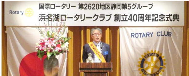
国際ロータリー 第2620地区静岡第5グループ 浜名湖ロータリークラブ 創立40周年記念式典