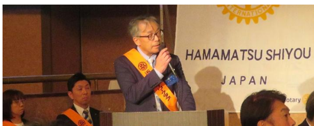
各クラブ交流例会成果発表