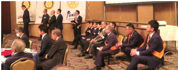
発表のまとめ・講評