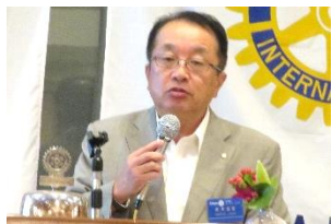
田中 信宏 ローターリー財団委員長