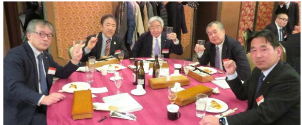
ロータリーソング【手に手つないで】